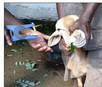
Immobilisation d'un mouton effectuée par l'éleveur pour une intervention

Exemple 3 : Ne pas introduire trop de nouvelles personnes en même temps pour la manipulation du troupeau.