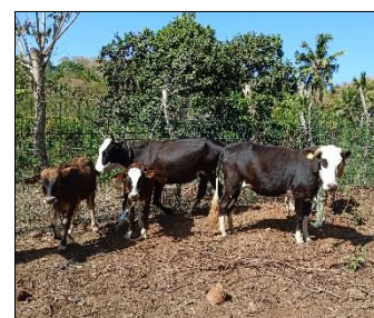
Petit troupeau de bovins dans un enclos extérieur

Exemple 3 : Prévoir une zone en l'extérieur ou mettre les animaux au pâturage