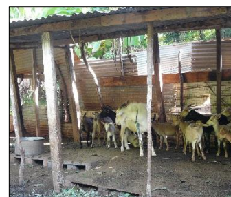
Espace abrité et surélevé pour protéger les caprins de la pluie

Exemple 3 : Faire une zone de couchage sèche et confortable, avec possibilité de créer sur un espace surélevé pour éviter la boue.