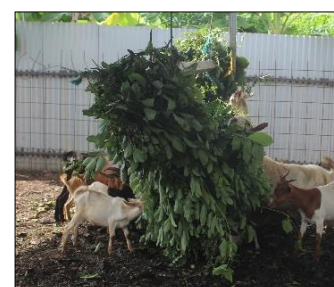
Fourrages distribués en quantité suffisante répartis en deux paquets

Exemple 3 : Faire plusieurs paquets de fourrage et les positionner à plusieurs endroits dans l'enclos.