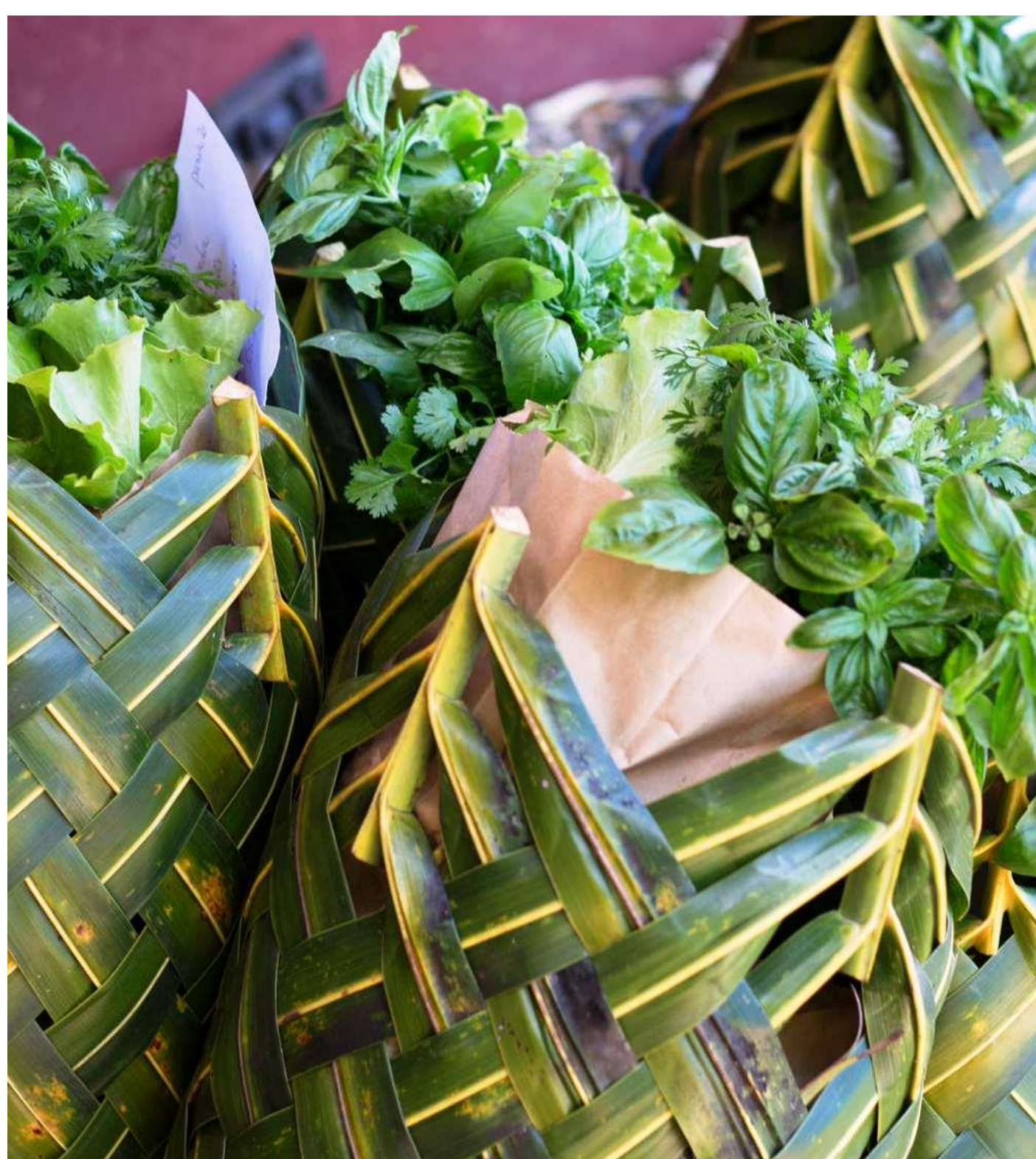
Participation de la cocoteraie de Valarano à la Foire agricole de Mayotte 2015 sur le terre plein de M'Tsapéré